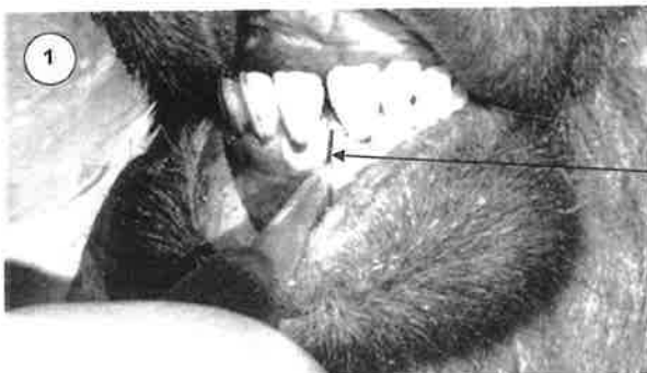
Une première coupe entre les deux dents.

Pour en arriver à de bonnes évaluations, il est toujours préférable d'avoir les deux incisives de chaque animal pour valider l'âge.