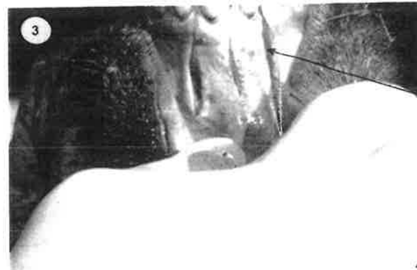
La même coupe à l'extérieur de l'autre incisive.