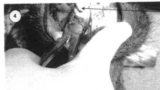
En utilisant des pinces à long bec, saisir la dent sous la couronne et l'arracher en effectuant un mouvement de rotation vers le menton de l'animal.

...puis on refait aussi une coupe à l'extérieur de l'autre incisive, toujours aussi profondément.