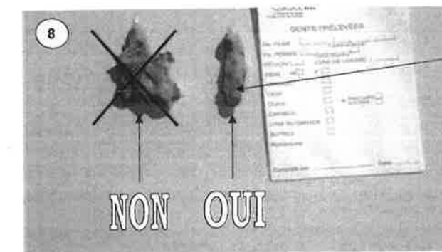
Les dents bien nettoyées et séchées sont mises dans une enveloppe bien identifiée, sans borax car cette substance présente des inconvénients lors de la manipulation et peut s'avérer nocive au niveau des sinus lorsque inhalée.

Bien important d'enlever tout surplus de chair de chaque spécimen.