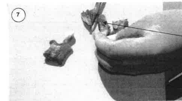
Enlever le plus de chair possible autour des incisives sans toutefois gratter la surface de la dent, ce qui pourrait altérer la lecture.

Il ne restera plus qu'à nettoyer les deux incisives; cette étape fera la différence entre une pièce anatomique de qualité ou une qui s'avérera inutilisable.