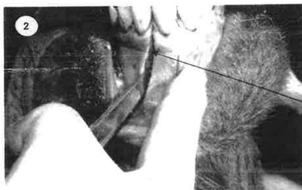
Une deuxième coupe à l'extérieur de l'incisive.

La première coupe se fait entre les deux incisives avec un couteau tranchant; plus la coupe est profonde, moins on aura à forcer pour déloger la dent.