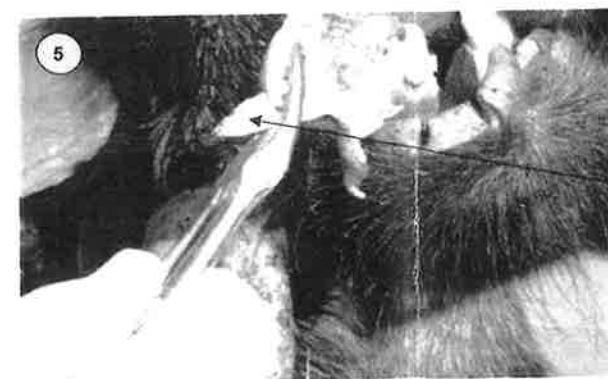
retirer de cette façon les deux incisives.

Il faut faire attention à cette étape de ne pas casser la racine de la dent; le cas échéant, inclure les deux parties de la dent cassée à l'envoi.