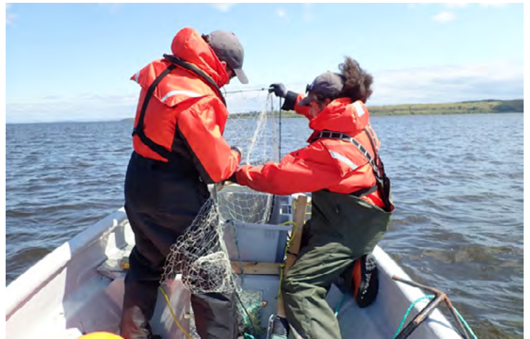
Photo : Deux techniciens de la faune du Bureau du Nionwentsio manipulant un filet lors de travaux d'inventaire sur le fleuve Saint-Laurent.

À l'été 2019, une équipe de quatre personnes a été déployée pendant 11 jours de pêche entre le 21 mai et le 19 juin afin de déterminer la présence d'un habitat essentiel dans le secteur de Beaupré. L'échantillonnage, effectué selon le protocole standardisé du ministère des Forêts, de la Faune et des Parcs, comportait notamment la capture et la mesure de poissons, mais aussi la récolte de données physico-chimiques à l'embouchure d'une rivière potentielle pour la fraie. Malgré les nombreux efforts, aucune frayère n'a été détectée en 2019. Les efforts d'acquisition de connaissances entrepris par le Bureau du Nionwentsio se maintiendront au moins pour les deux prochaines années.