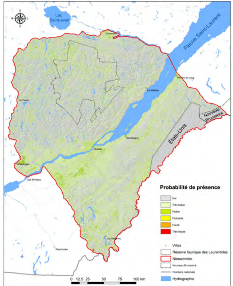
Indice de qualité d'habitat pour la berce laineuse (Poglus) sur le territoire du Nionwentsiö