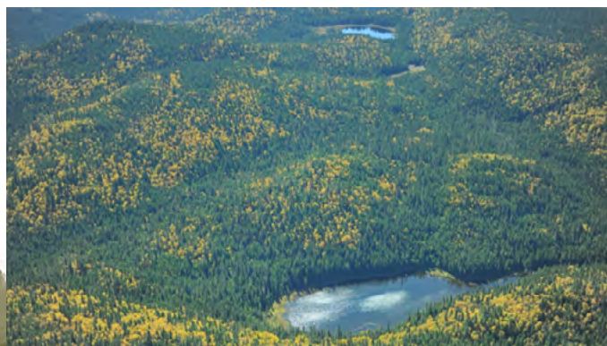
Vue aérienne du massif de forêt intacte dans la région du lac à Moïse