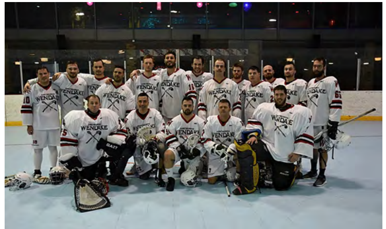
L'Équipe de crosse Ahki'wahcha' de Wendake au Sin City Box Classic 2020