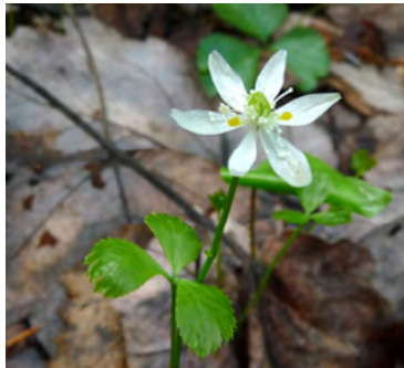
Coptide trifoliée (Savoyane)