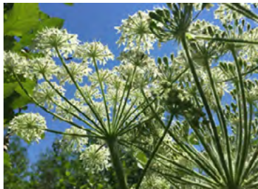
Berce laineuse (Poglus)