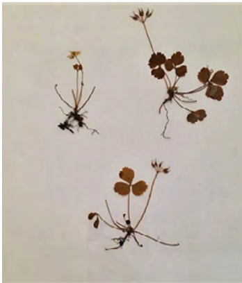
Coptide trifoliée (Savoyane)

La savoyane ou coptide trifoliée ( Coptis trifolia ) est une plante possédant principalement deux utilisations traditionnelles chez les Hurons-Wendat. Ses feuilles, sa tige et ses racines peuvent être utilisées comme teinture. En effet, la savoyane produit un jaune vif, rappelant la couleur de ses racines dorées. L'autre utilisation traditionnelle de la coptide trifoliée par les Hurons-Wendat est plutôt d'ordre médicinal. Effectivement, la savoyane aide à la guérison des ulcères buccaux; elle peut également s'utiliser pour traiter les maux d'estomac. De manière générale, la savoyane est estimée pour ses vertus antiscorbutiques, stomachiques, toniques et antiseptiques. Encore utilisée de nos jours par les Hurons-Wendat, la savoyane est une plante incontournable en matière de médecine traditionnelle.