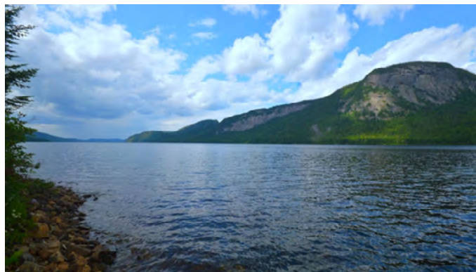
Ekiontarowänha (Lac Batiscan)

En 2019, le CNHW a reçu une subvention d'Environnement Canada pour la concrétisation de ce projet, dont le financement s'échelonne jusqu'en mars 2023. Ce financement permet entre autres de mettre en marche plusieurs campagnes d'échantillonnage en collaboration avec de nombreux partenaires afin de décrire la richesse et l'unicité du territoire à protéger. Ainsi, le CNHW s'est associé avec des chercheurs en biologie de l'Université Laval, de l'Université du Québec à Montréal, de l'Université du Québec à Chicoutimi, du Service Canadien de la Faune, du Centre de Foresterie des Laurentides et du Zoo de Granby, en plus d'un chercheur en économie de l'Université du Québec en Outaouais et d'un chercheur en archéologie de l'Université Laval. De nombreuses équipes de recherche arpenteront donc le territoire à protéger à l'été 2020.