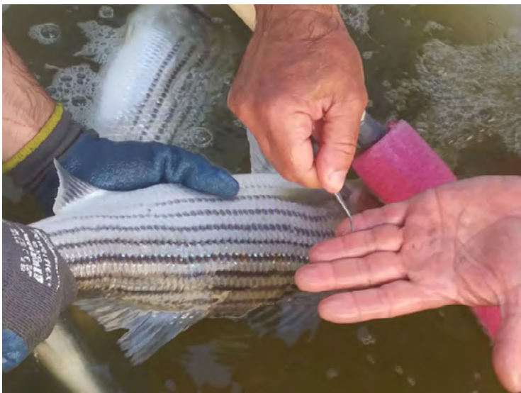
Photo : Prélèvement d'écaillés sur un bar rayé lors d'une collaboration entre le Bureau du Nionwentsio et Englobe

Ce programme avait pour objectif de rétablir une population de bars rayés dans le fleuve en réintroduisant dans le fleuve des individus provenant de la rivière Miramichi, au Nouveau-Brunswick. Rappelons que le bar rayé avait disparu complètement du Fleuve dans les années 1960. Cette particularité sur l'origine de la population actuelle amène présentement une incertitude sur le statut de la population. Bien que la population semble se rétablir graduellement, le COSEPAC, un comité d'experts ayant comme rôle d'évaluer la situation des espèces sauvages au Canada, a déterminé en 2019 que la population d'origine est disparue. Chose certaine, les activités visant à mieux connaître le bar rayé du Saint-Laurent et à identifier et à réduire les menaces à son rétablissement doivent se maintenir.