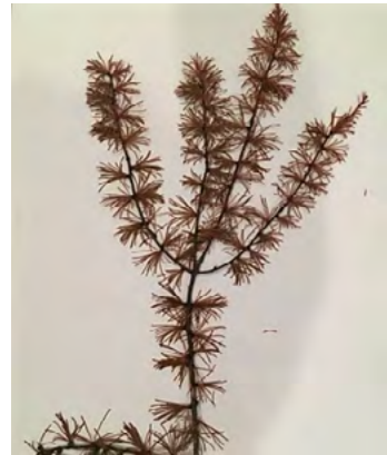
Mélèze laricin (Épinette rouge)

Finalement, l'équipe de recherche a également créé des brochures afin de transmettre les informations recueillies en plus de réaliser un atelier à l'École primaire Wahta'. Ces activités visent à prendre part à tout type de projet qui touche la santé des membres, la transmission des savoirs et la pratique de ses activités coutumières sur le Nionwentsio dans un contexte de changements climatiques. Dans le même ordre d'idées, un deuxième article fera la présentation de deux plantes importantes dans l'histoire des Hurons-Wendat, à savoir le Poglus – Berce laineuse ( Heracleum maximum ) et la Savoyane – Coptide trifoliée ( Coptis trifolia ).