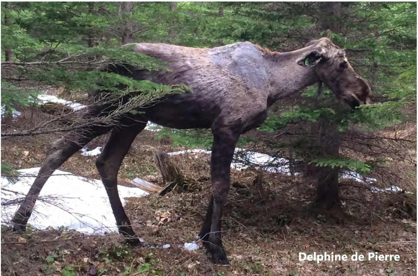
Delphine de Pierre

Pour plus d'informations, contactez Florent Déry à l'adresse courriel suivante : toc@bio.ulaval.ca