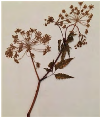
Berce laineuse (Poglus)

La grande berce ou « berce laineuse » ( Heracleum maximum ), que les Hurons-Wendat nomment le « poglus », est une plante qui possède des propriétés médicinales hors du commun. Se retrouvant essentiellement sur le bord de la route et des ruisseaux, cette dernière est réputée pour contrer la grippe. D'ailleurs, fait historique intéressant, le poglus a été employé avec succès par les Hurons-Wendat de Wendake pour combattre l'épidémie de grippe espagnole qui sévissait au Québec en 1918. Riches de cette connaissance médicinale traditionnelle et transmise de génération en génération, les Hurons-Wendat continuent, encore à ce jour, de soigner fièvre et grippe avec le poglus.