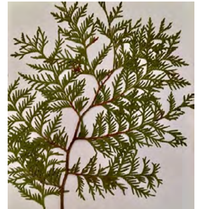
Thuya occidentale (Cèdre)