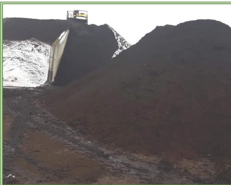
Compost Centre de traitement de Saint-Henri