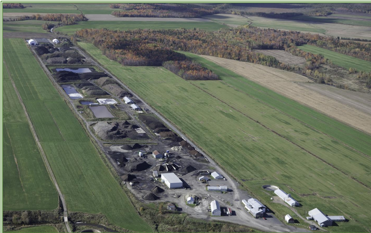
Centre de traitement de Saint-Henri (GSI Environnement, une division d'Englobe)

Veillez trouver ci-dessous des photos du cheminement des bacs bruns de Wendake.