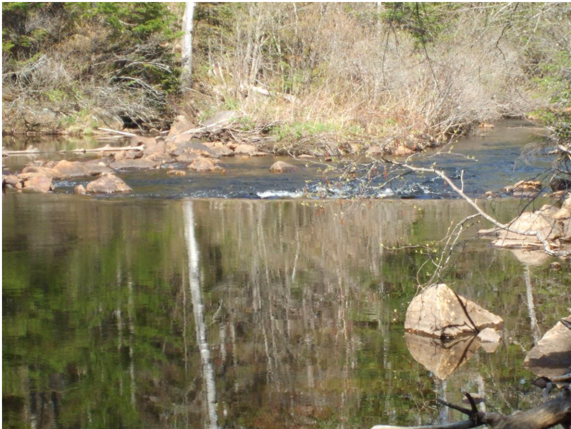
Figure 1 : Rivière Castor (photo prise le 14 mai 2015)

Le secteur Crique Castor échantillonné avait une longueur de 3,5 km (Annexe 2). Cette rivière a été échantillonnée les 14 et 25 mai 2015. Les habitats favorables à la ponte où les bancs de graviers exondés étaient quasi inexistantes sur ce secteur de rivière. Pour la majeure partie du cours d'eau échantillonné, les berges étaient rarement supérieures à un mètre. De plus, on retrouvait sur la rivière plusieurs sections de courant assez rapide. Les aulnaies étaient présentes sur une bonne partie du tronçon, mais se limitaient aux abords des berges et n'étaient pas très larges. On retrouvait aussi plusieurs sections où les peuplements forestiers étaient à dominance résineuse et donc peu favorables pour la tortue. Donc, ce secteur offrait un faible potentiel d'habitats favorables pour la tortue des bois mis à part quelques courtes sections présentant un certain potentiel.