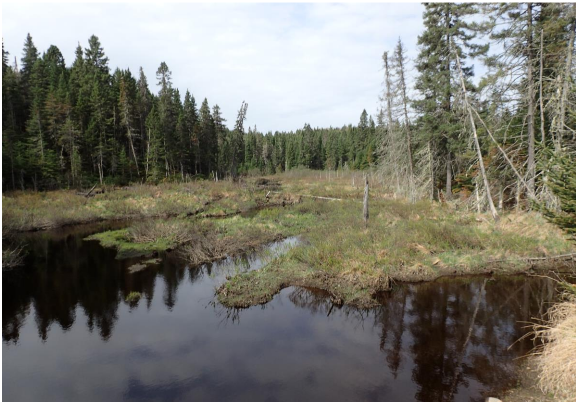
Figure 3 : Début du tronçon du secteur Limace/Prézeau (photo prise le 21 mai 2015)

Le secteur échantillonné entre les lacs Limace et Prézeau présentait alors une longueur de 1,7 km (Annexe 2) et a été échantillonné le 21 mai 2015 (voir figure 3). Ce secteur démontrait très peu d'habitats potentiels pour la tortue des bois. En effet, aucun banc de gravier n'a été retrouvé et les aulnaies étaient peu présentes. De plus, ce cours d'eau se rétrécissait considérablement à mesure que l'on avançait vers le Lac Prézeau, atteignant parfois une largeur de 30 cm. Bref, cet habitat se rapprochait beaucoup plus d'un milieu humide. Face à ce constat, un deuxième passage dans ce secteur n'a pas été jugé nécessaire.