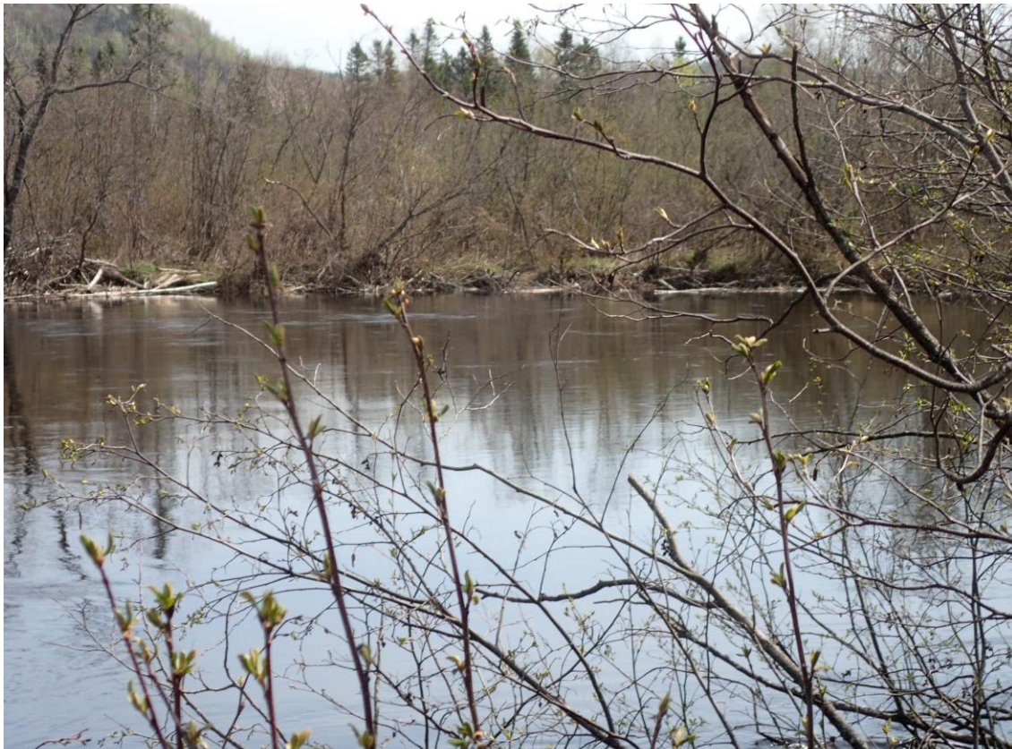
Figure 2 : Secteur potentiel : rivière Blanche (photo prise le 15 mai 2015)

Le secteur échantillonné de la rivière Blanche avait une longueur de 1,3 km (Annexe 2). Cette rivière a été échantillonnée les 15 et 25 mai 2015. Ce secteur présentait, lors des deux campagnes terrain, des bancs de gravier exondés sporadiques sur le cours d'eau. On y retrouvait également des berges ayant une hauteur très variable qui variait entre 0 et 1 mètre par rapport au cours d'eau. Les aulnaies étaient également peu présentes aux abords du cours d'eau excepté à quelques endroits précis où elles étaient de qualité pour la tortue des bois. Généralement, ce secteur offrait peu de potentiel d'habitats pour la tortue des bois mis à part quelques sections bien précises.